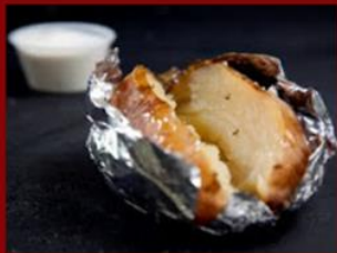
תפוז אפוי 11