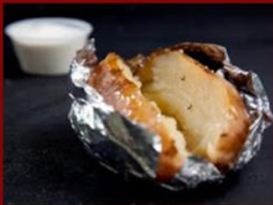
תפוז"א אפוי 11ש