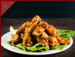
הכנפיים של דיקס 74 - 34