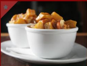
הום פרייז 24ש