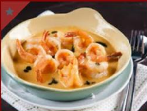
שרימפס בחמאה, שום ויין לבן 46ש