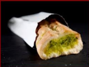
בגט שום 18ש