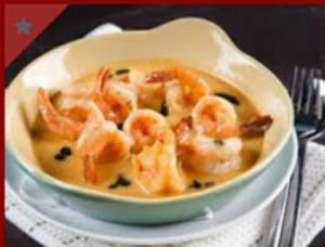
שרימפס בחמאה, שום ויין לבן 46